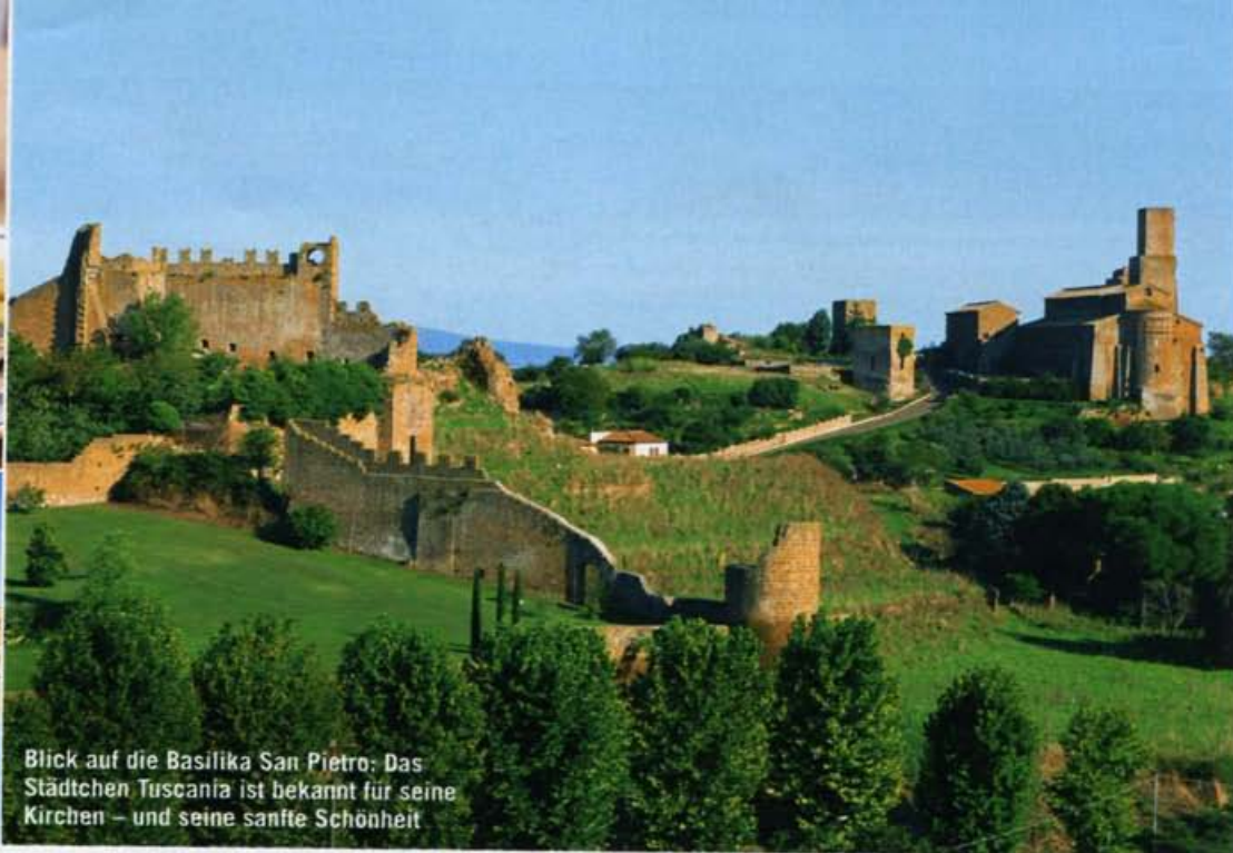
Blick auf die Basilika San Pietro: Das Städtchen Tuscania ist bekannt für seine Kirchen – und seine sanfte Schönheit