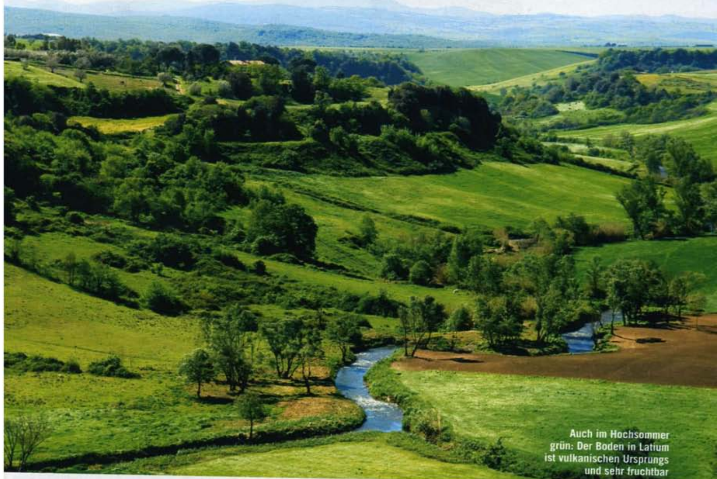
Auch im Hochsommer grün: Der Boden in Latium ist vulkanischen Ursprungs und sehr fruchtbar