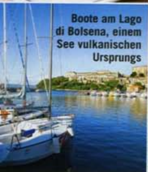
Boote am Lago di Bolsena, einem See vulkanischen Ursprungs