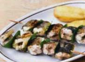
schön traditionell: Küche im Latium