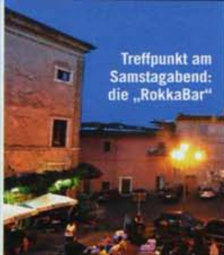
Treffpunkt am Samstagabend: die „RokkaBar“